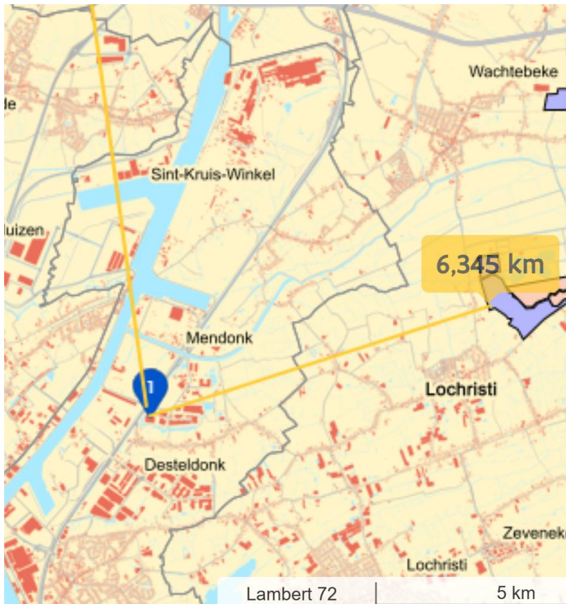
Gebieden van het VEN en IVO

Indien voor deze, meest nabijgelegen, zones de strengst mogelijke KDW wordt aangenomen, 6 (kg N/(ha.j)), kan ook voor deze zones het maximaal toegelaten aantal vervoersbewegingen vastgelegd worden. Op basis van tabellen 3 en 4 zoals opgenomen in 'Voertuigemissies en de minimalisnormen: een analytische benadering voor wegverkeer' (VITO-rapport 2024/EI/R/3195) zouden echter meer voertuigen toegelaten zijn dan in voorgaande benadering. Voor beide vervoerscategorieën wordt het maximaal aantal vervoersbewegingen niet bereikt en dus is een nieuwe aftoetsing niet relevant.