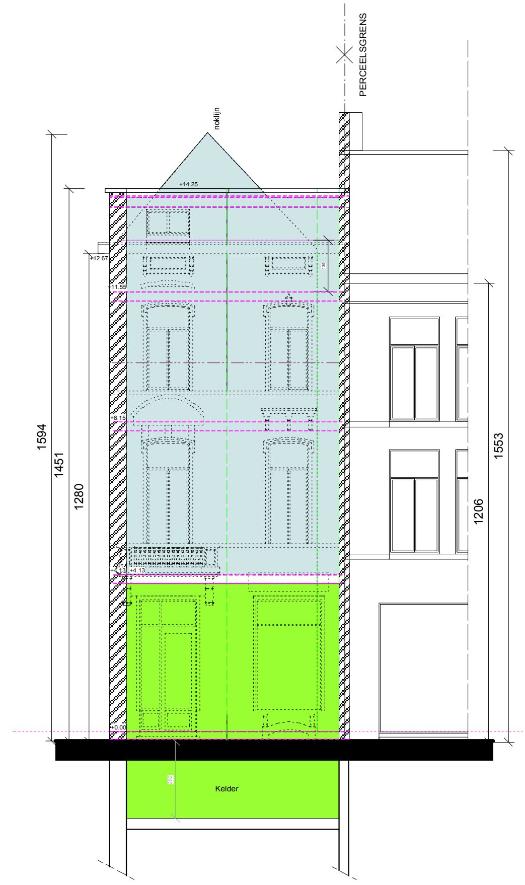
DWARSE DOORSNEDE BESTAANDE TOESTAND