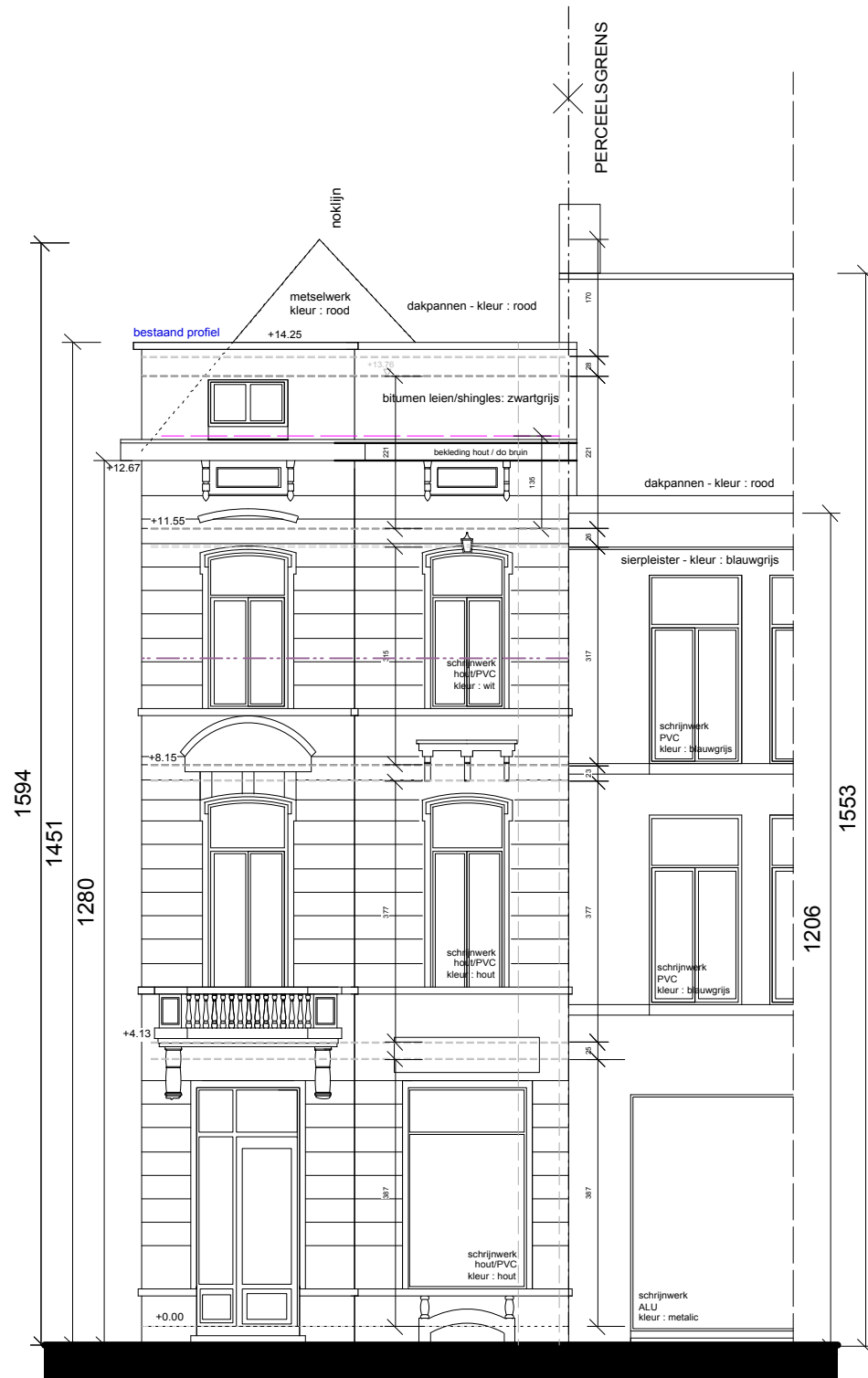
GEVEL BRABANTDAM BESTAANDE TOESTAND