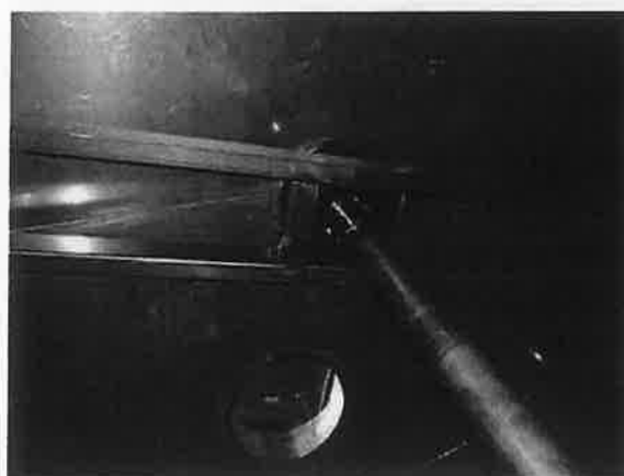
Figuur 4: Dak