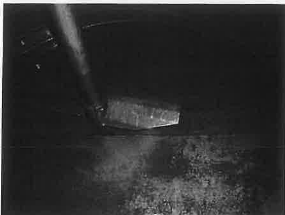
Figuur 1: Lassen bodem