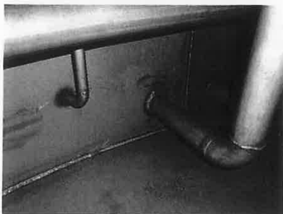
Figuur 3: Lasverbinding bodem met cilindrische wand