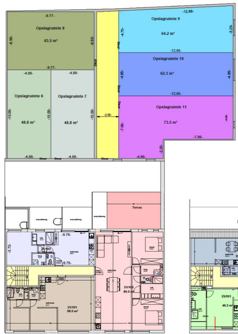
NIVEAU 01 VAN DEN HECKESTRAAT

Van Den Heckestraat 19-21 9050 GENT/Ledeberg Gent 20 o afdeling - A 133H2 Plannen behorend bij PV van Verdeling