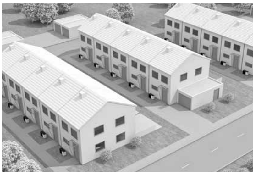
Bijzonder stille werking, ideaal voor gebruik op locaties met rijhuizen

Via de Vitotronic 200-regeling kunt u de warmtepompen vanaf eender welke locatie via de onlinemodule Vitoconnect (toebehoren) en de gratis ViCare-app bedienen.