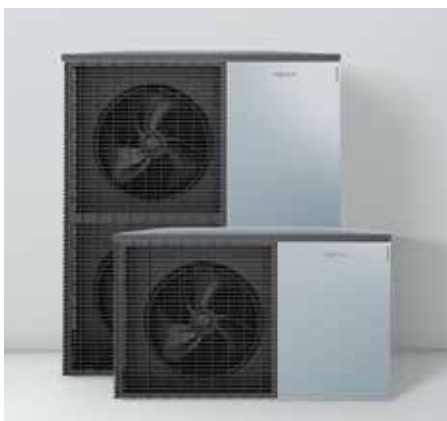
Buitenunits in Viessmann-design: Made in Germany