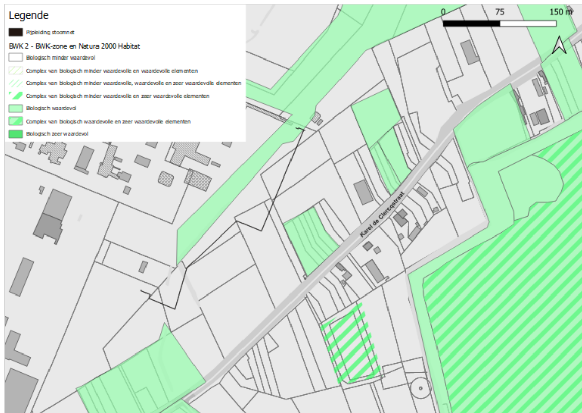
Figuur 1: biologische waarderingskaart t.o.v. de stoomturbine en stoomleidingen.