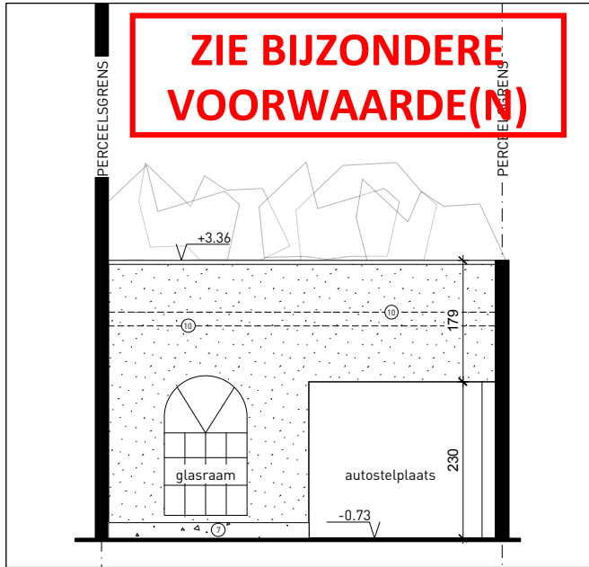
binnengevel - uitbreiding