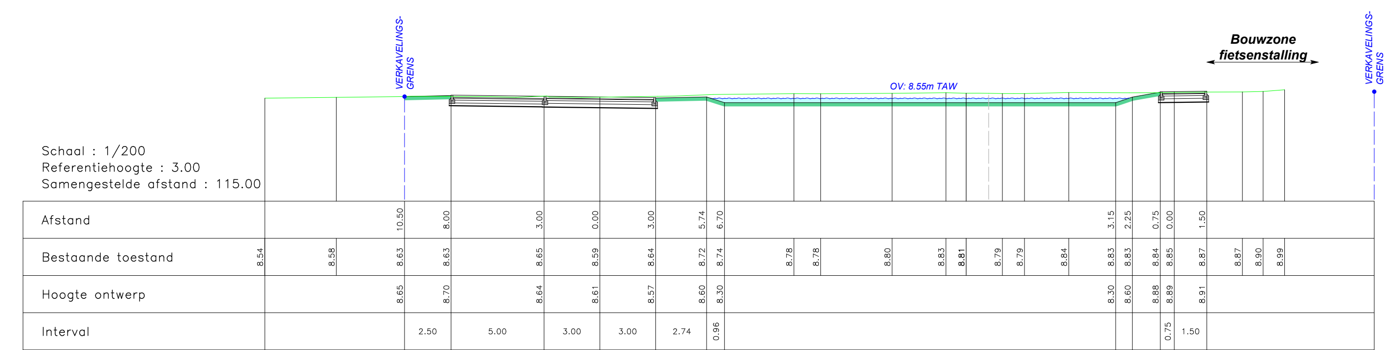
Profiel Nr. 3