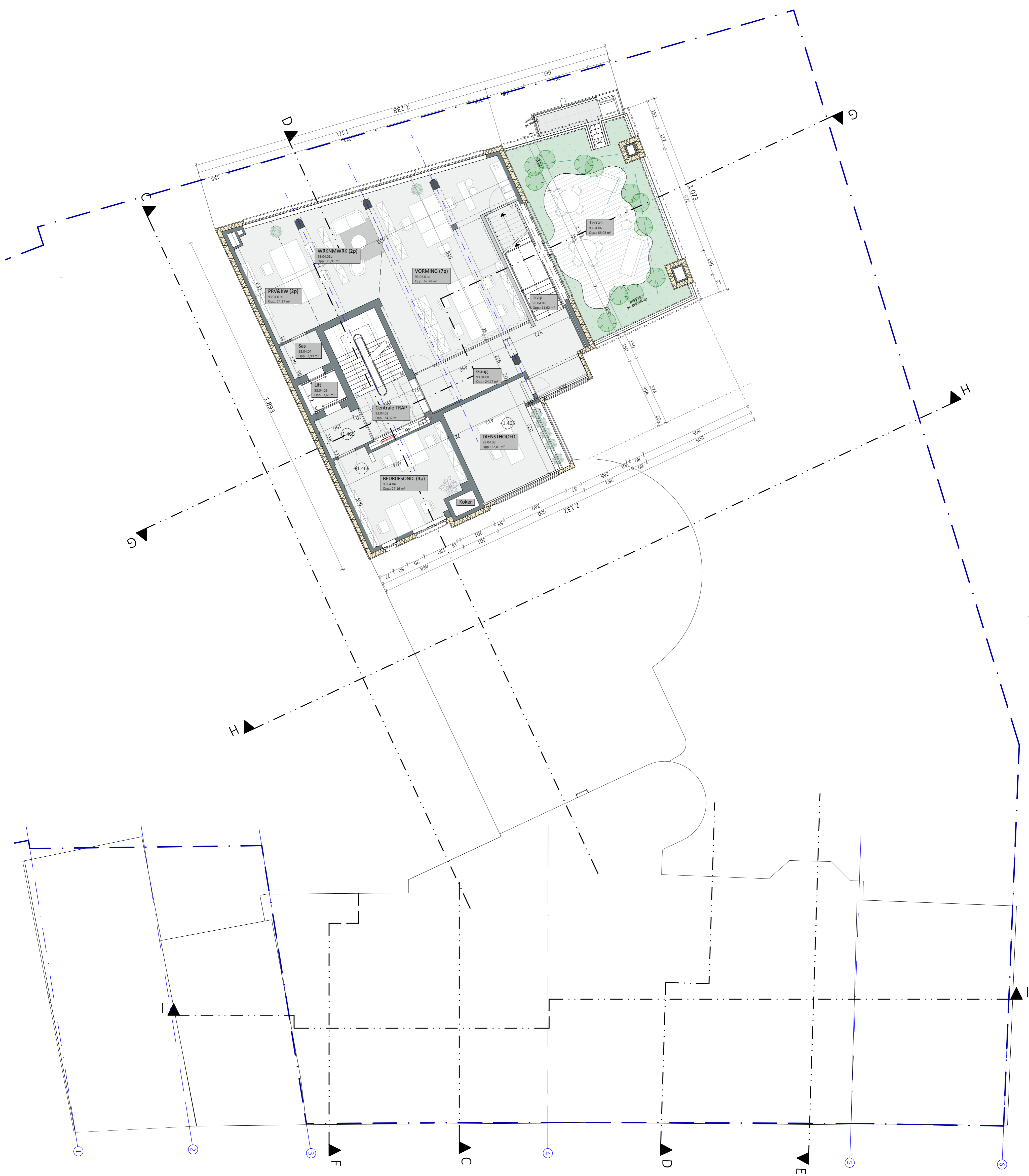
04_Verdieping 04 1:100