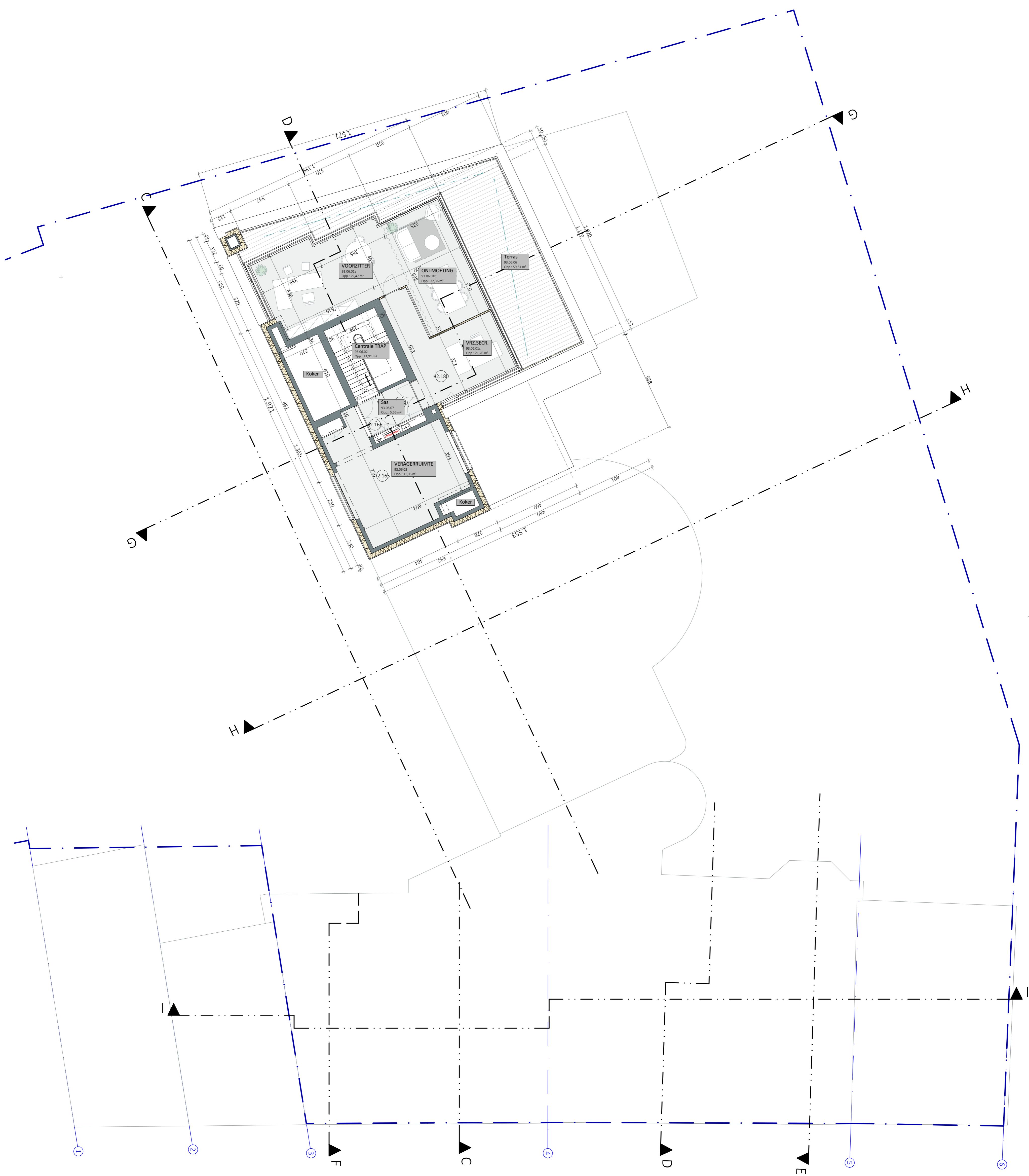
06_Verdieping 06 1:100