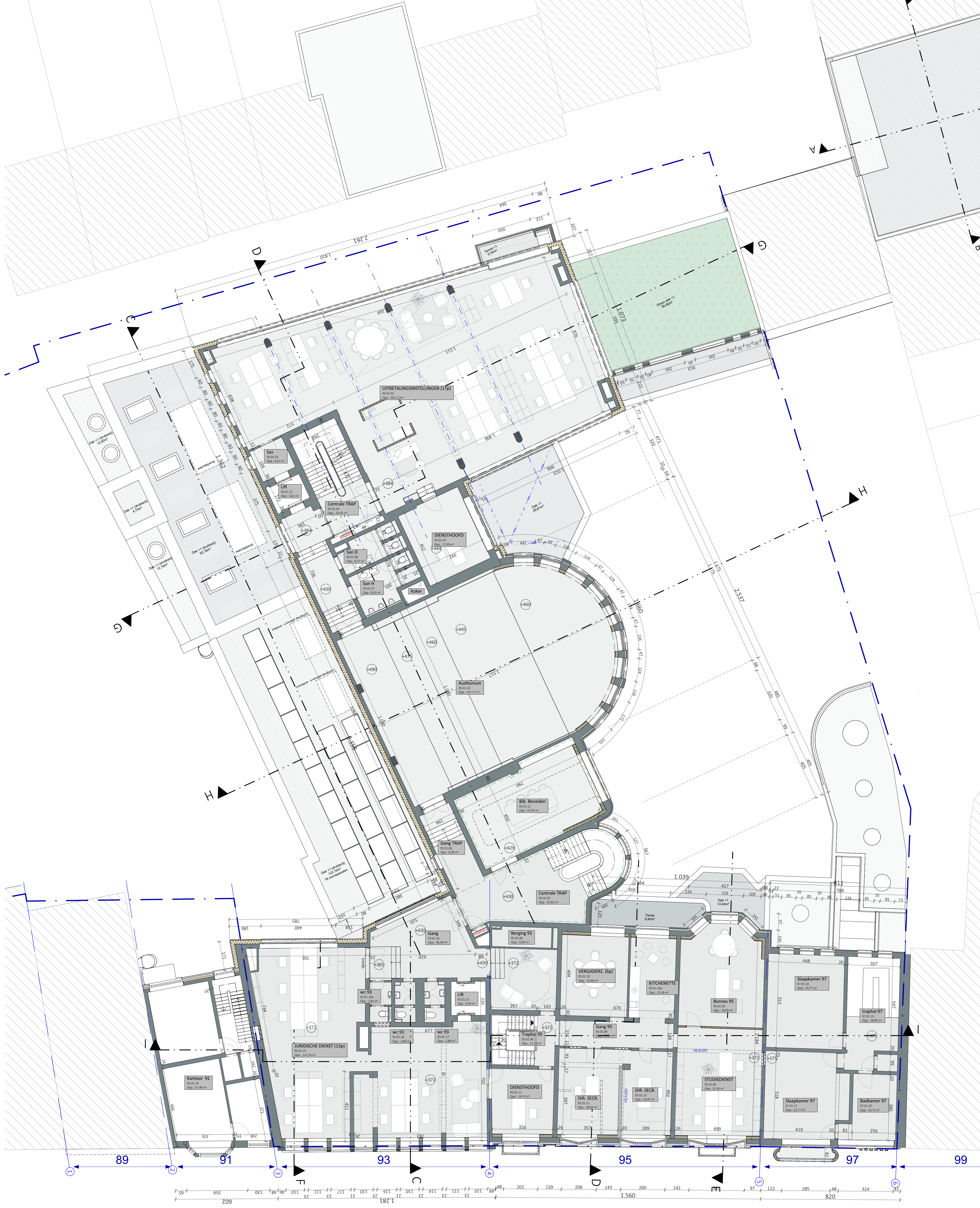
01_Verdieping 01 1:100