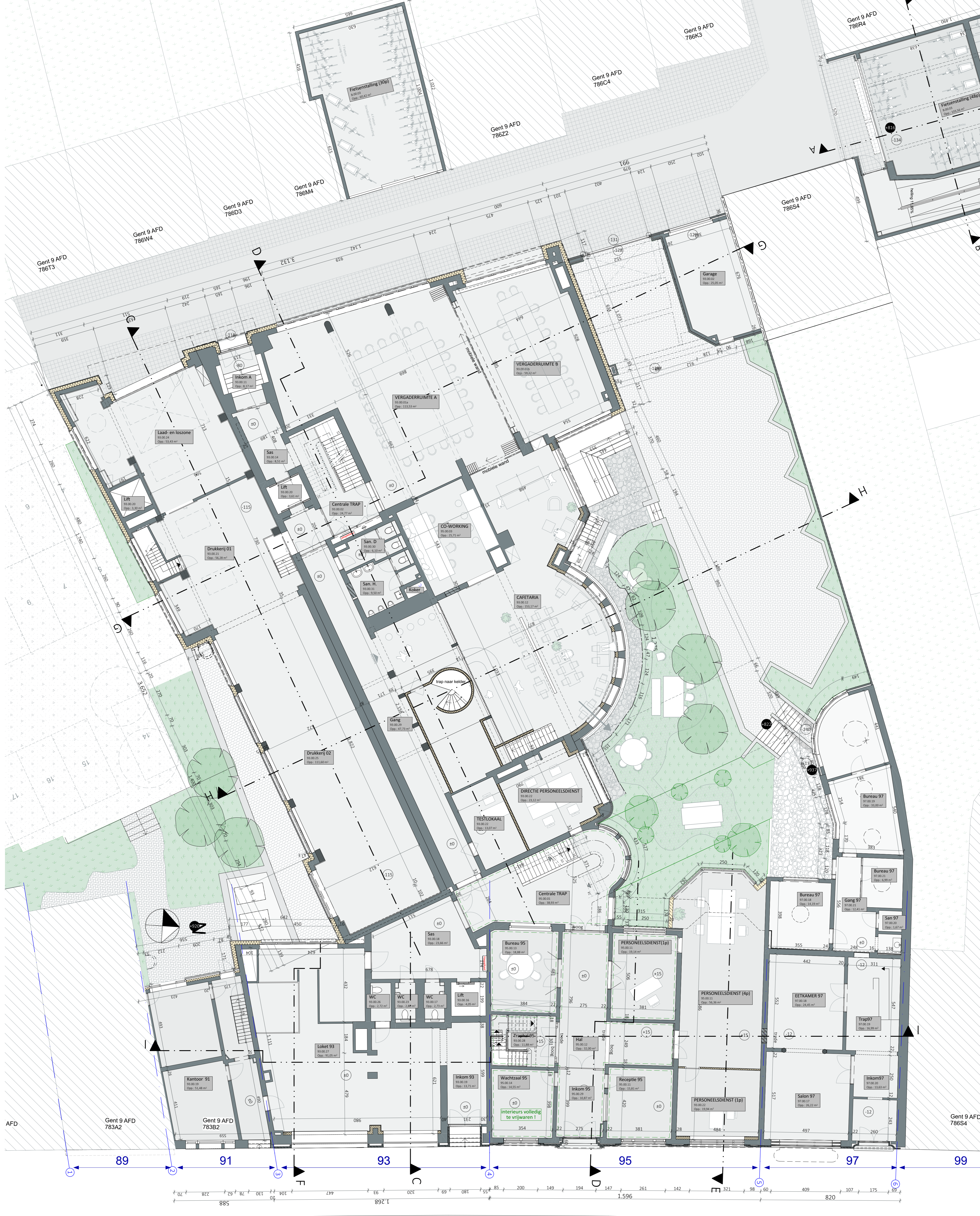
00_Gelijkvloers 00 1:100