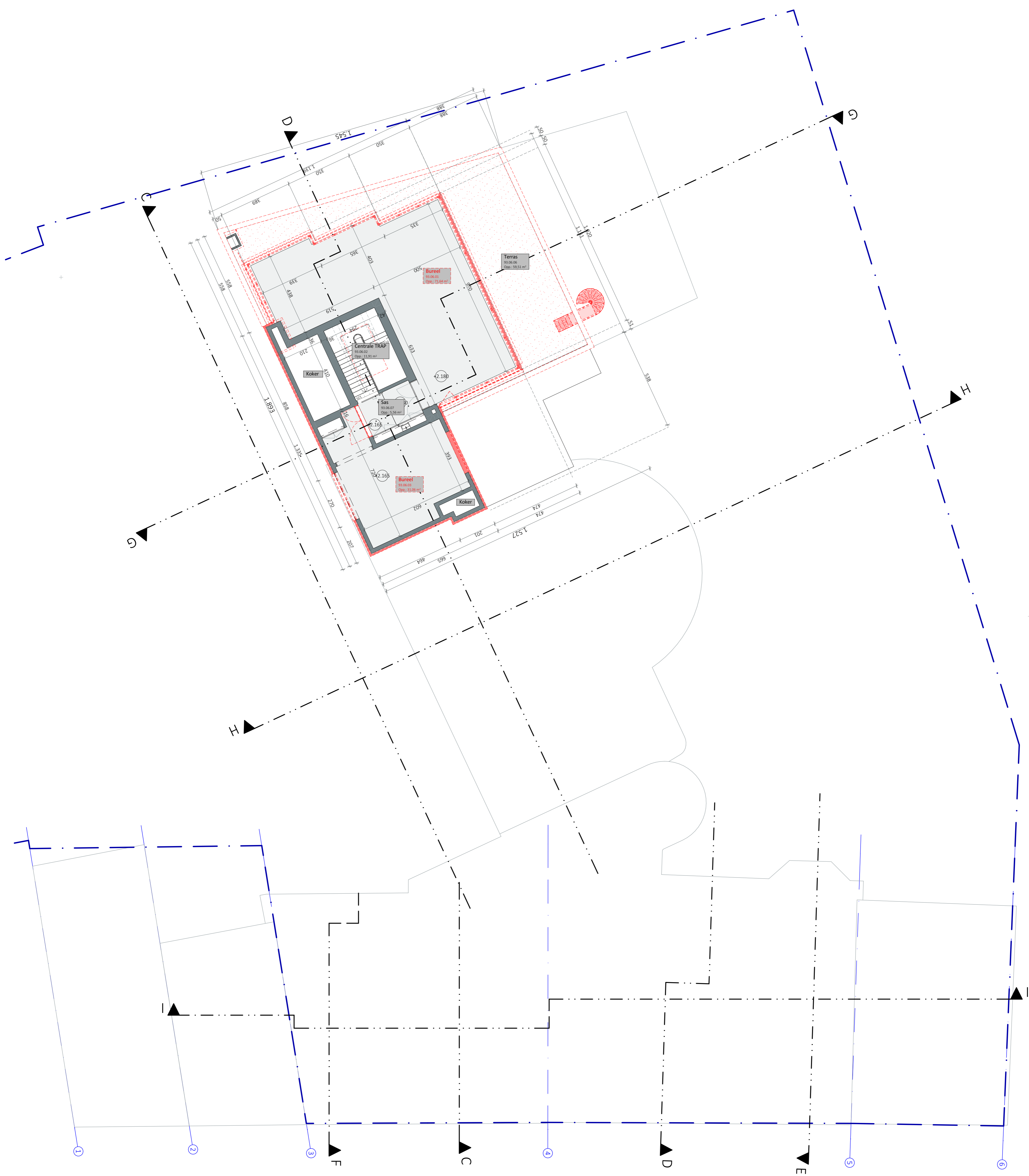
06_Verdieping 06 1:100