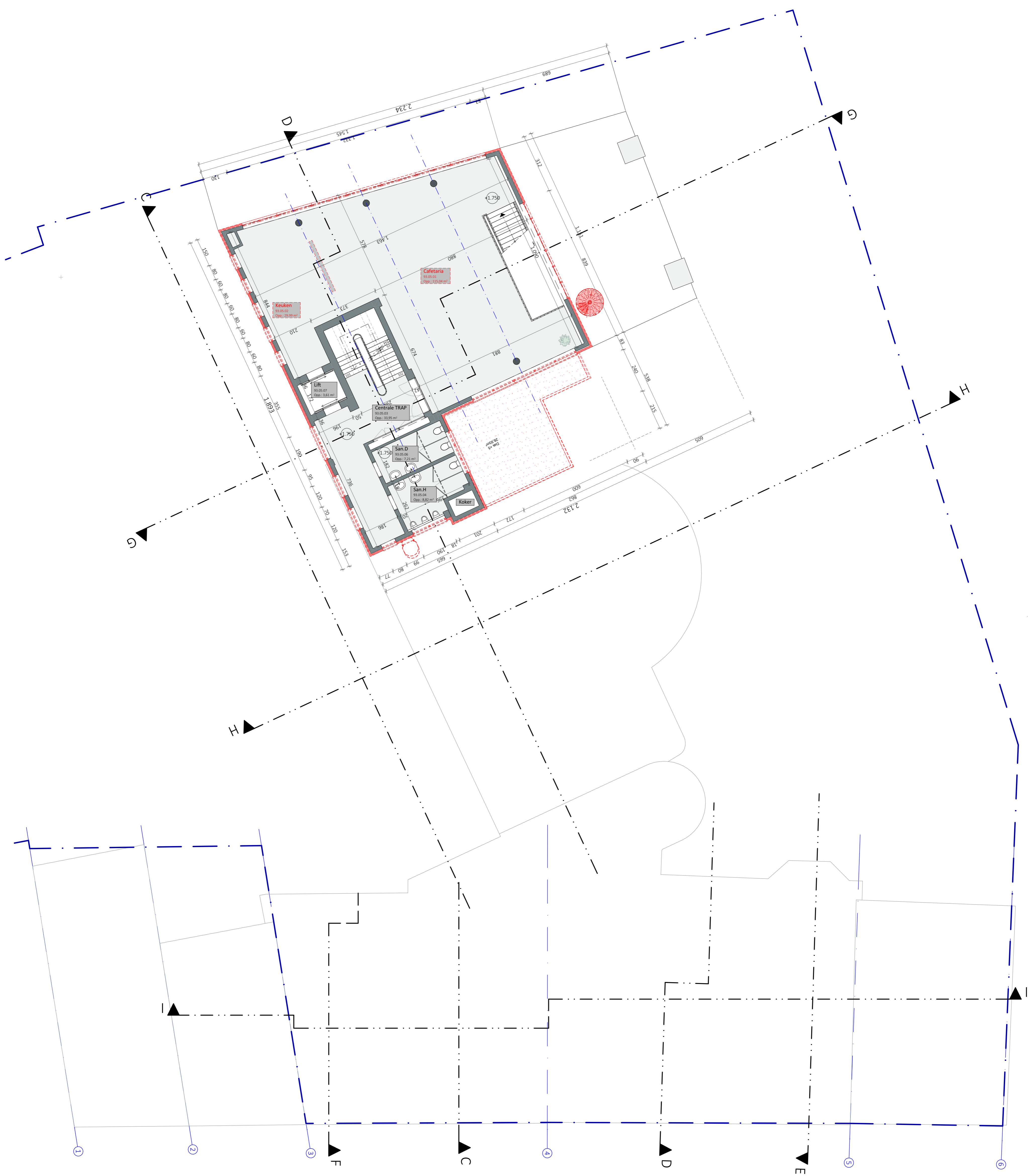
05_Verdieping 05 1:100