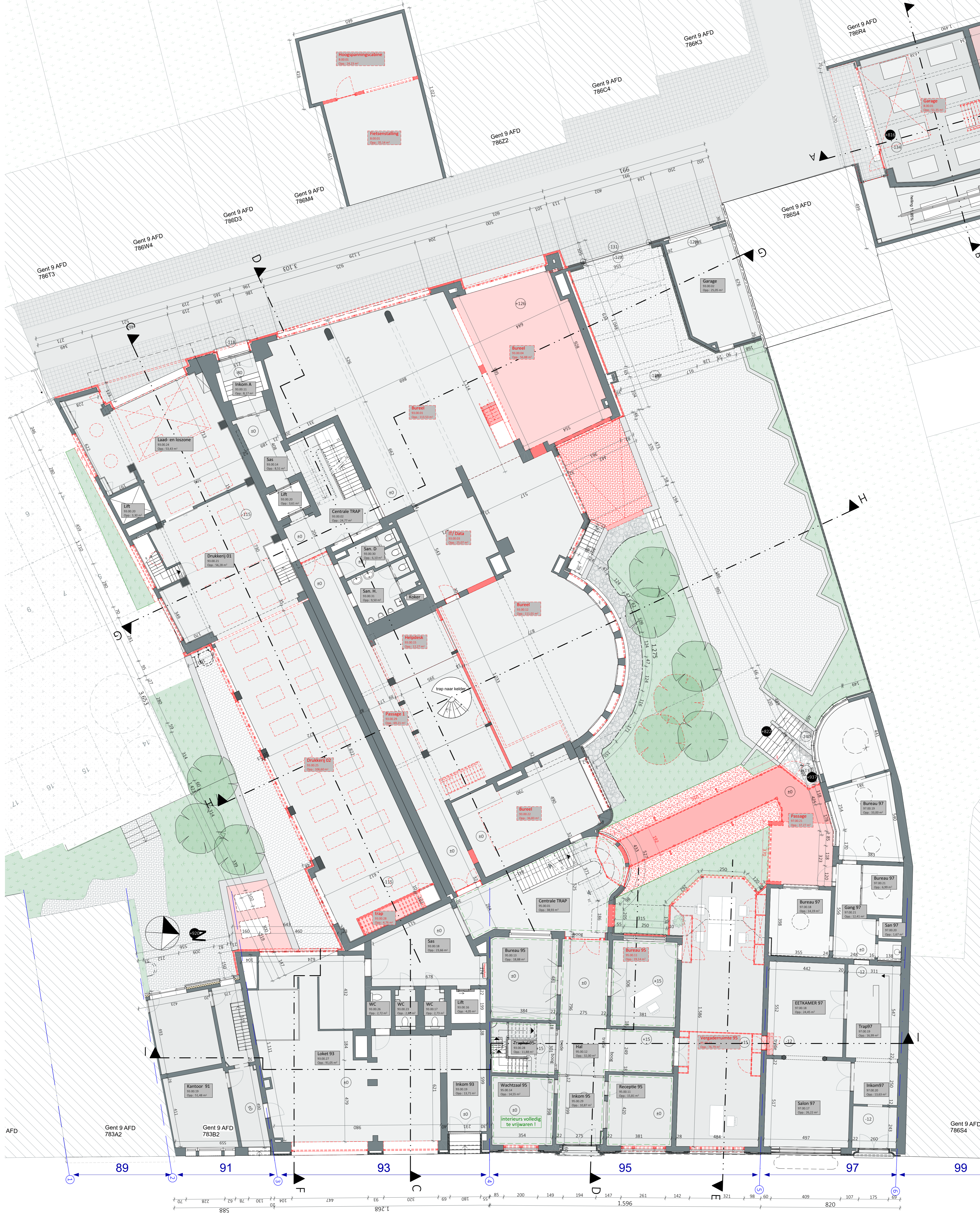
00_Gelijkvloers 00 1:100