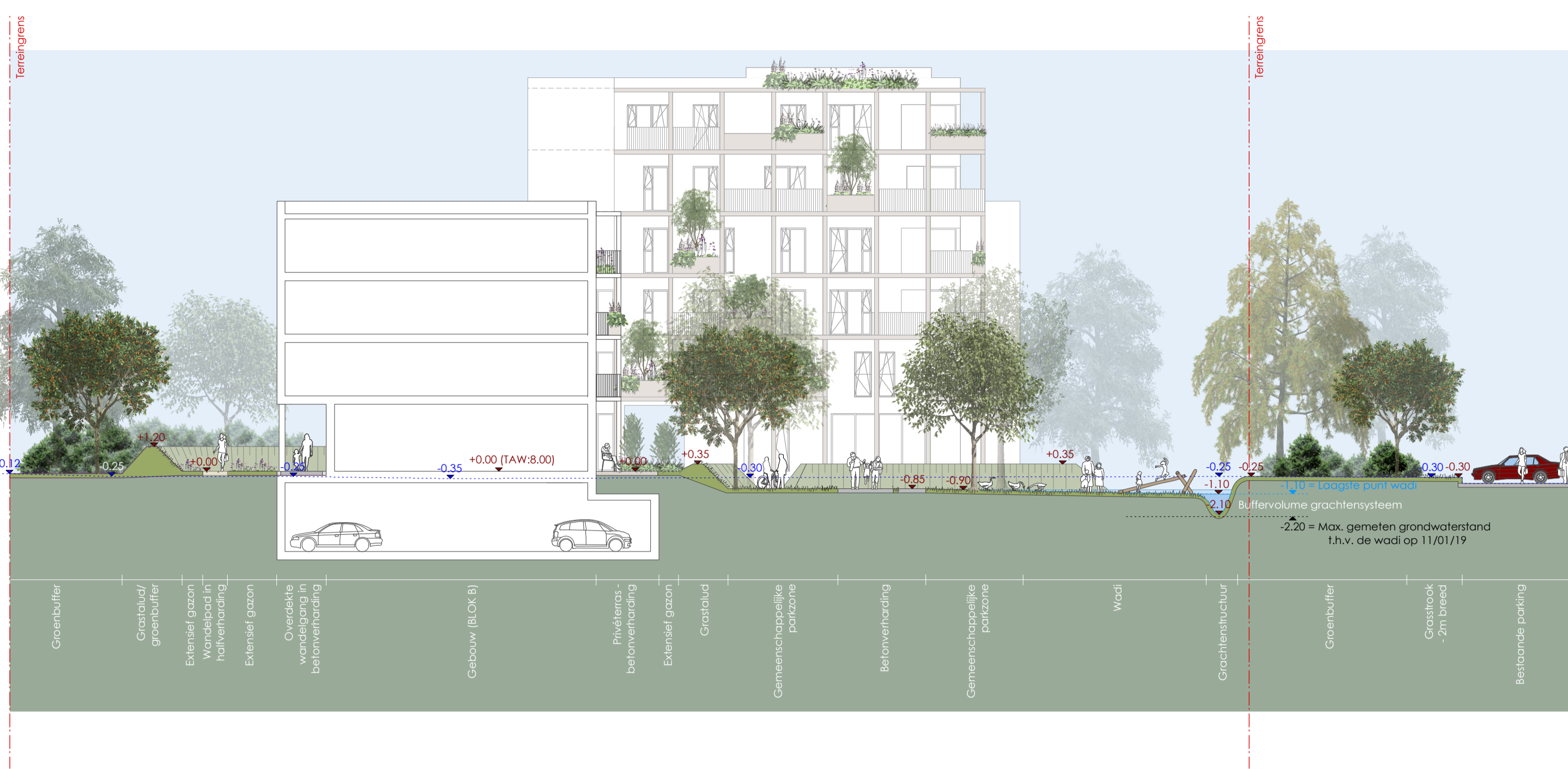
TERREINPROFIEL B-B' - schaal 1/200