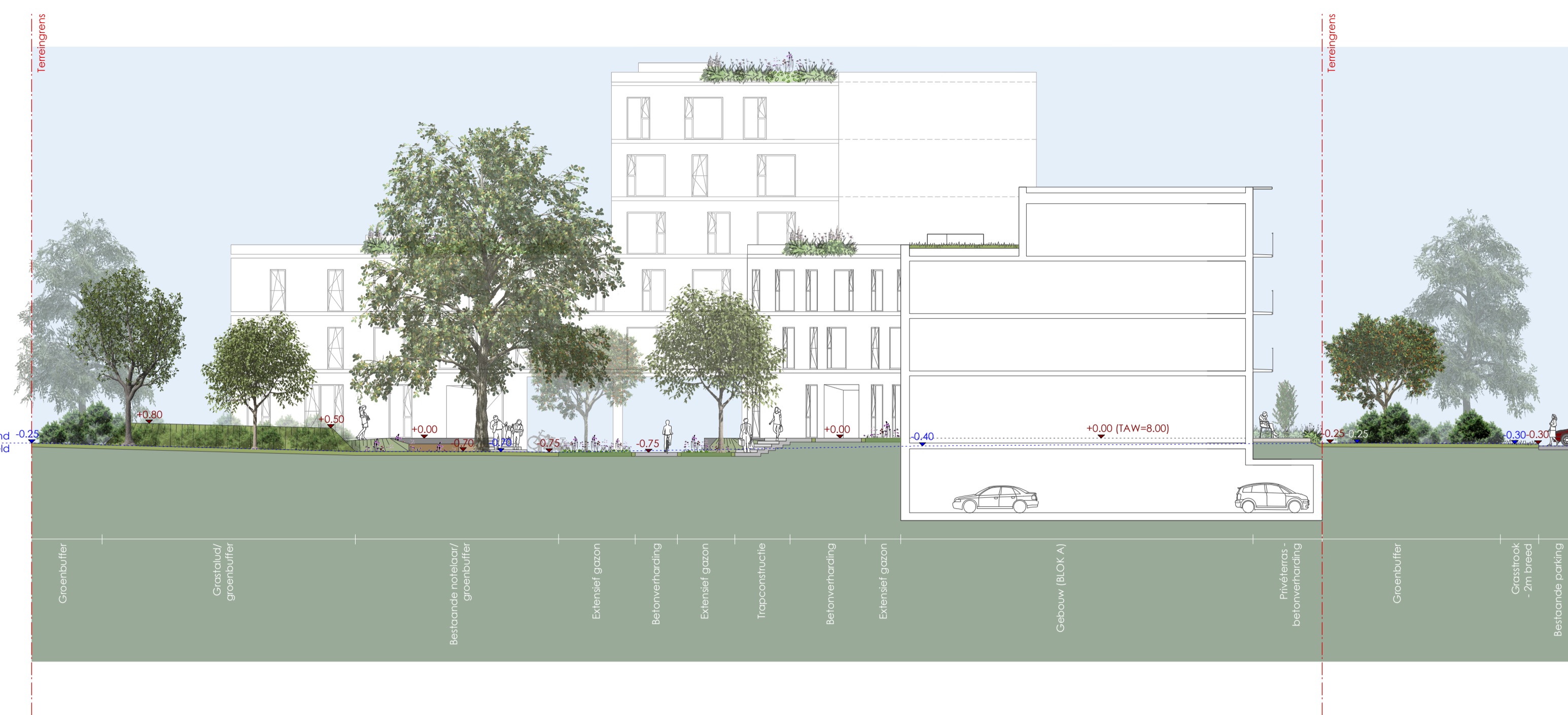
TERREINPROFIEL A-A' - schaal 1/200