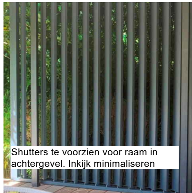
Shutters te voorzien voor raam in achtergevel. Inkijk minimaliseren