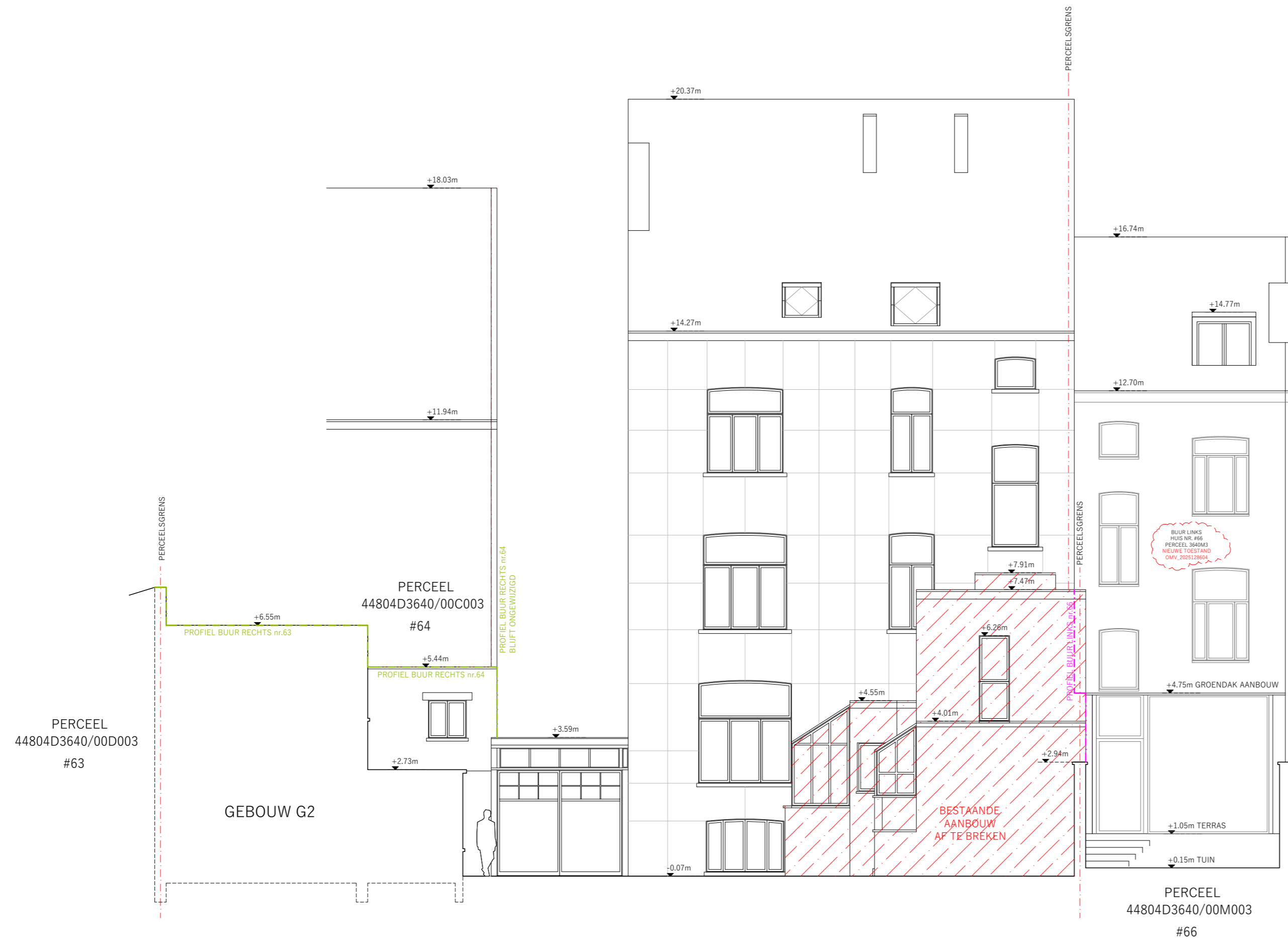
TERREIN PROFIEL B | BESTAANDE TOESTAND | SCHAAL 1:100