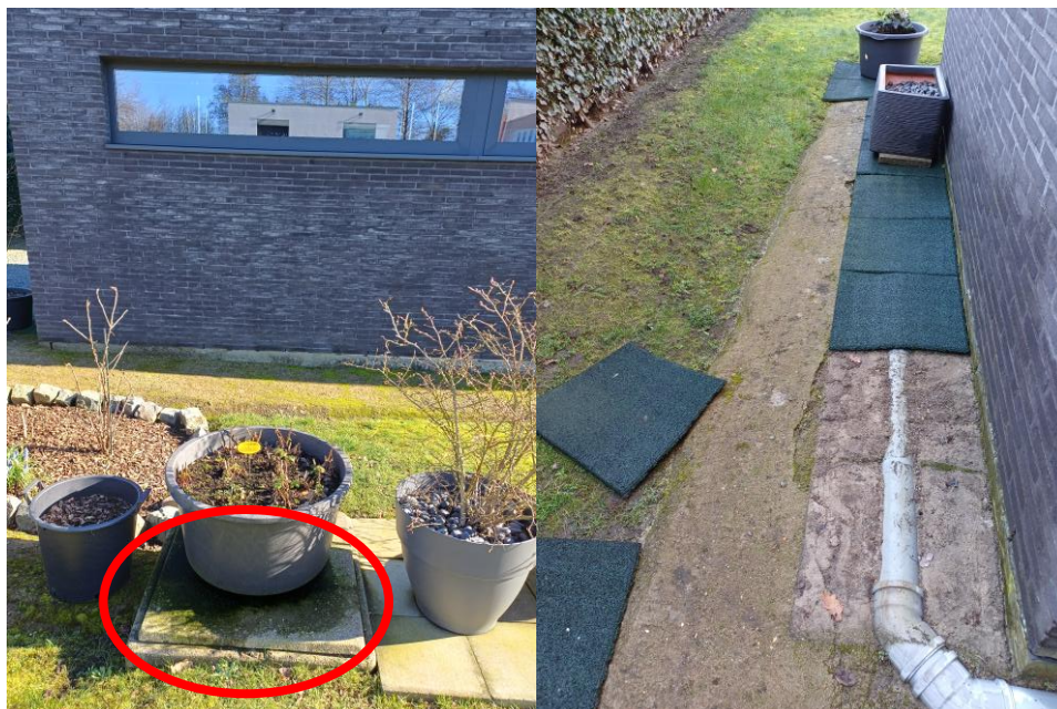
DEKSEL VAN HEMELWATERPUT VAN 20 000 L