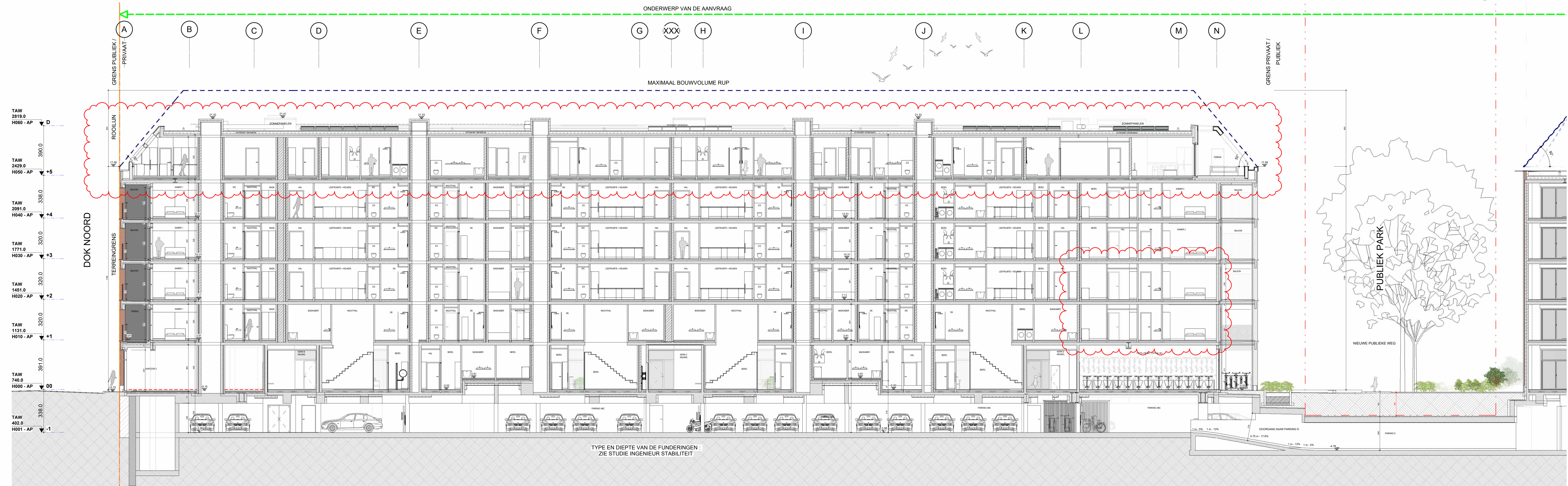
TYPE EN DIEPTTE VAN DE FUNDERINGEN: ZIE STUDIE INGENIEUR STABILITEIT