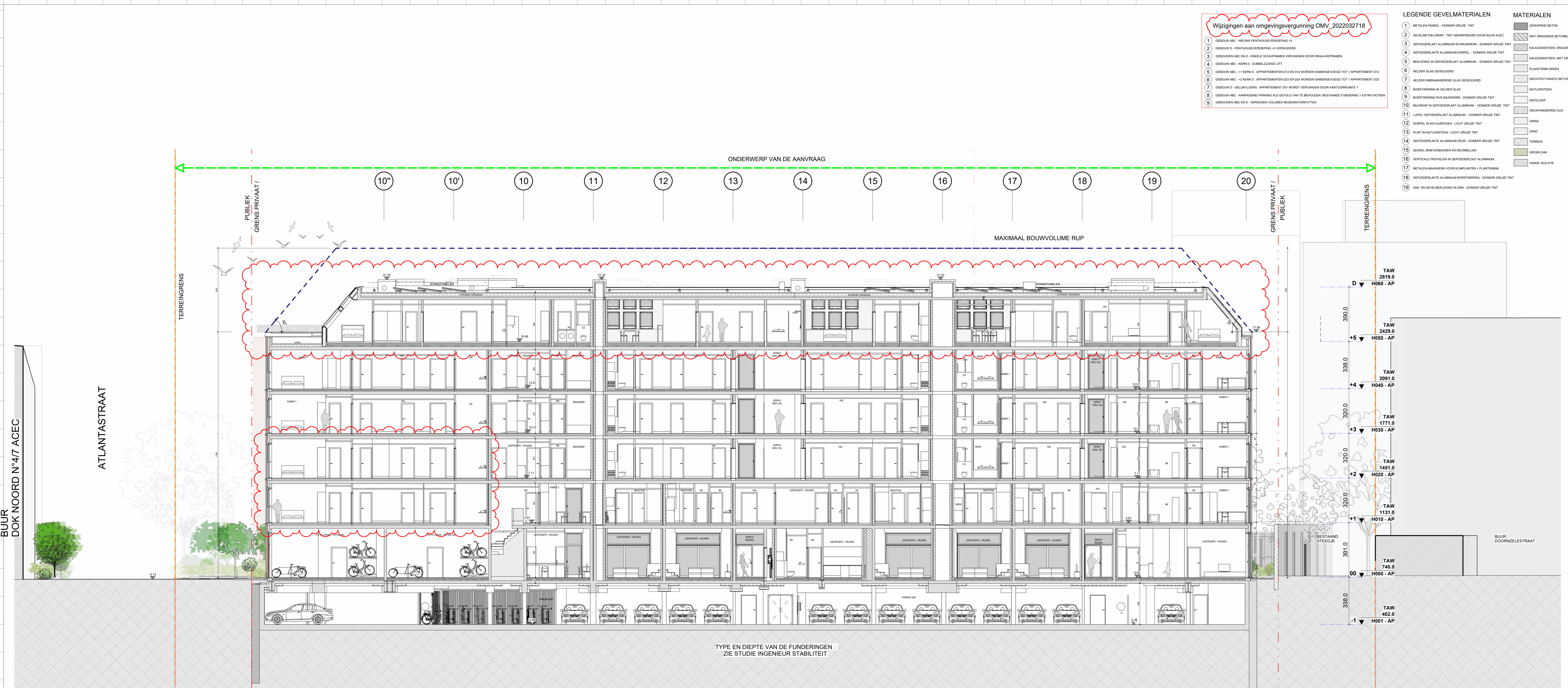
TYPE EN DIEPTTE VAN DE FUNDERINGEN : ZIE STUDIE INGENIEUR STABILITEIT