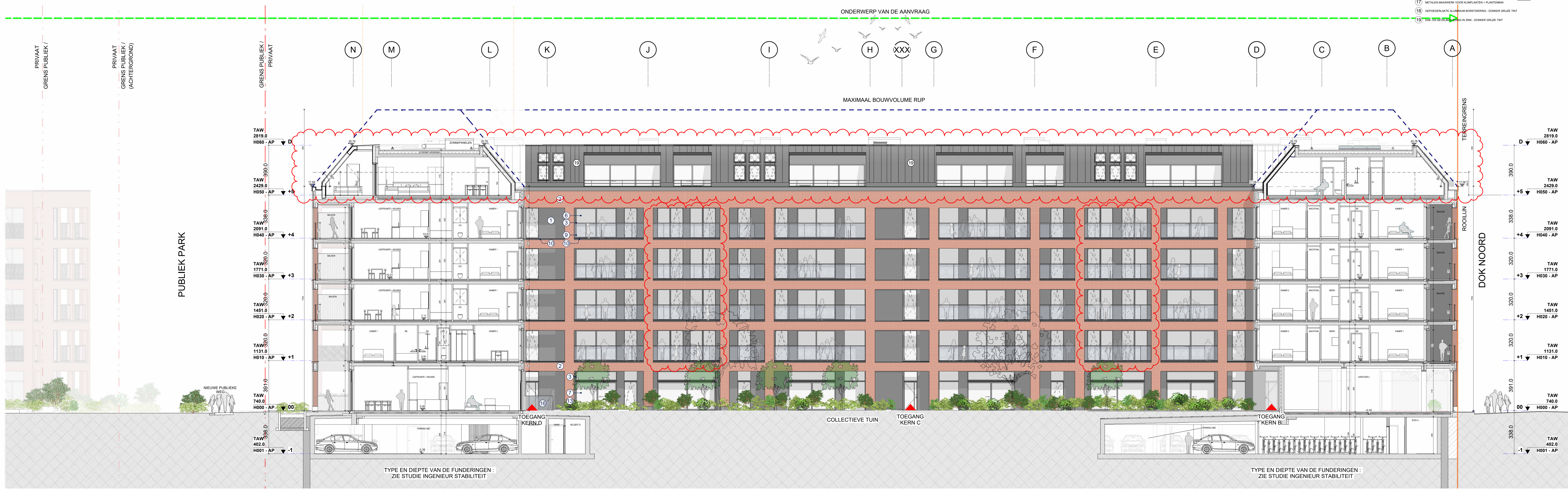
TYPE EN DIEPTTE VAN DE FUNDERINGEN : ZIE STUDIE INGENIEUR STABILITEIT