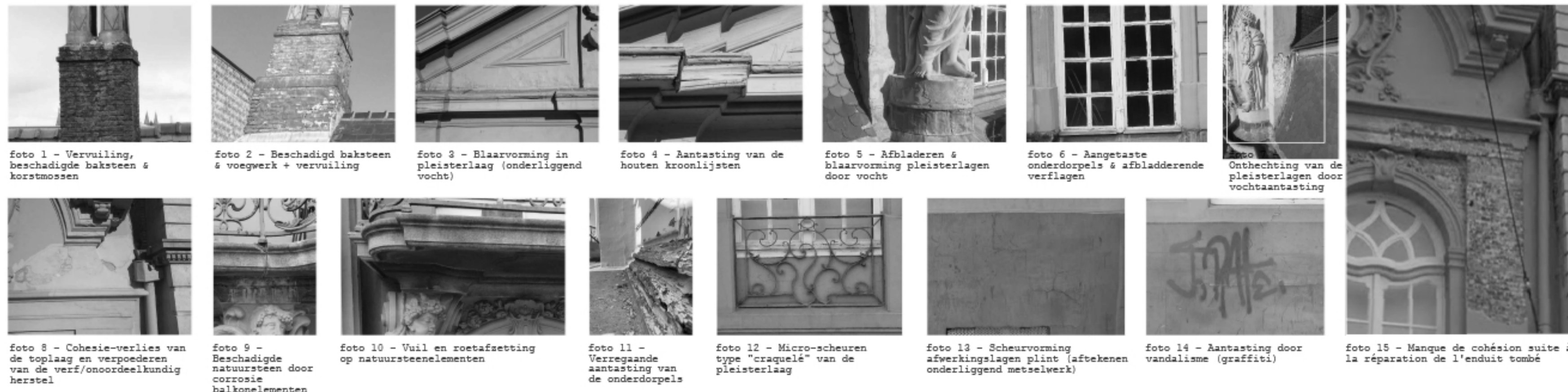
foto 1 - Vervuiling, beschadigde baksteen & korstmossen

niet exhaustieve fotoreportage van typerende gebreken & beschadigingen