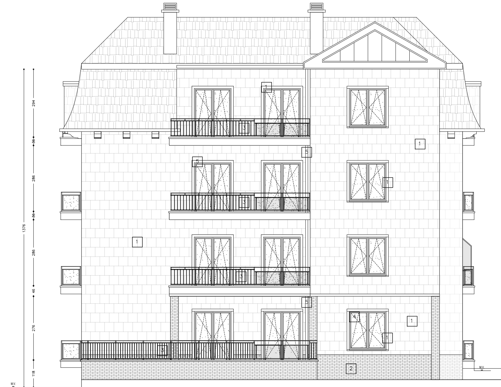
VOORGEVEL - ZUIDOOST GEVEL BESTAANDE TOESTAND