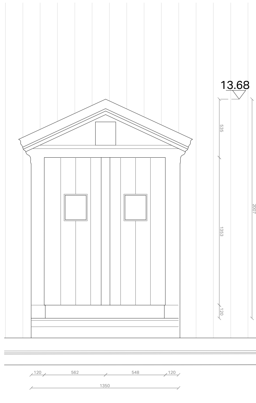
Aanzicht exterior schaal 1/20