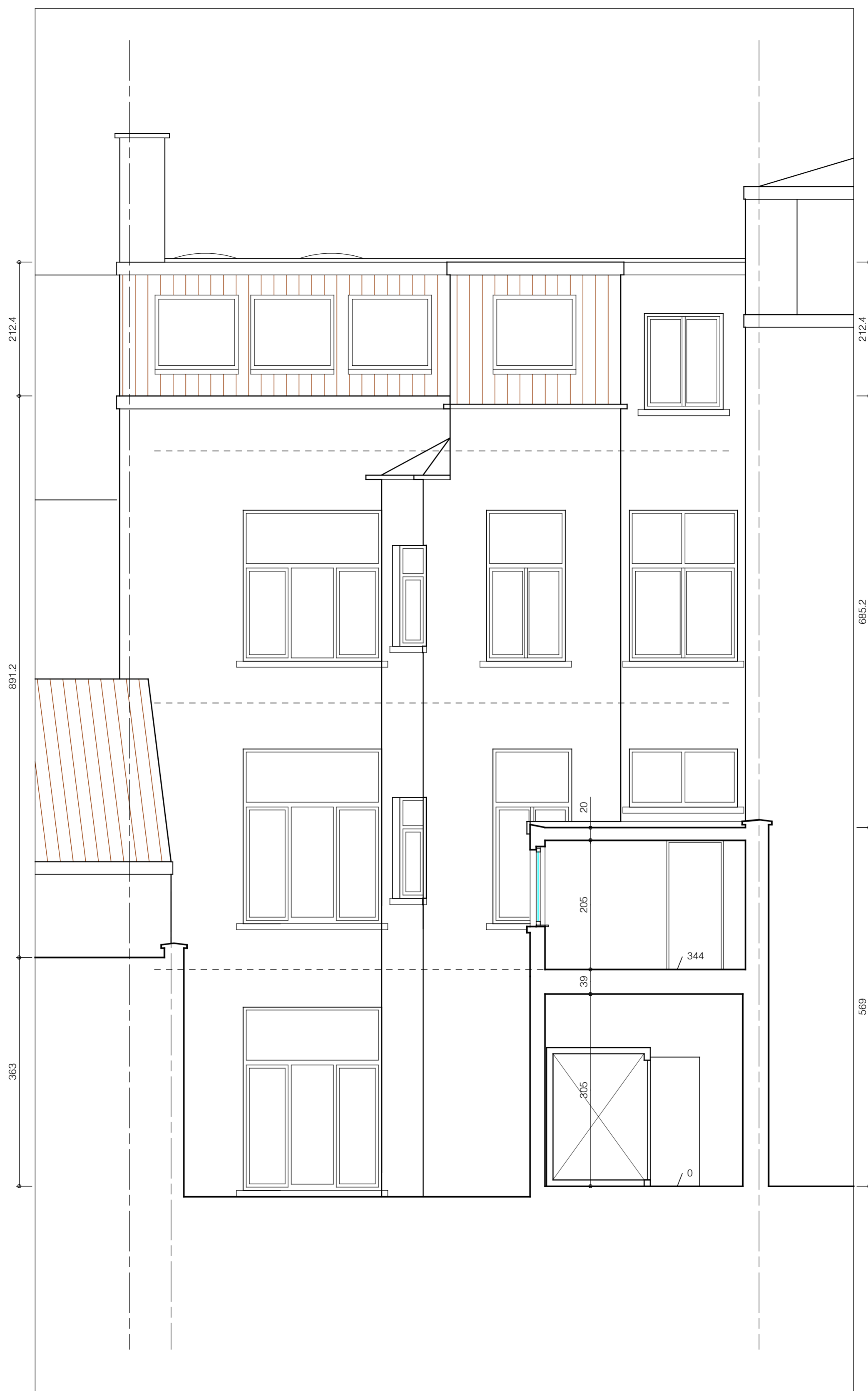
achtergevel - snede 2