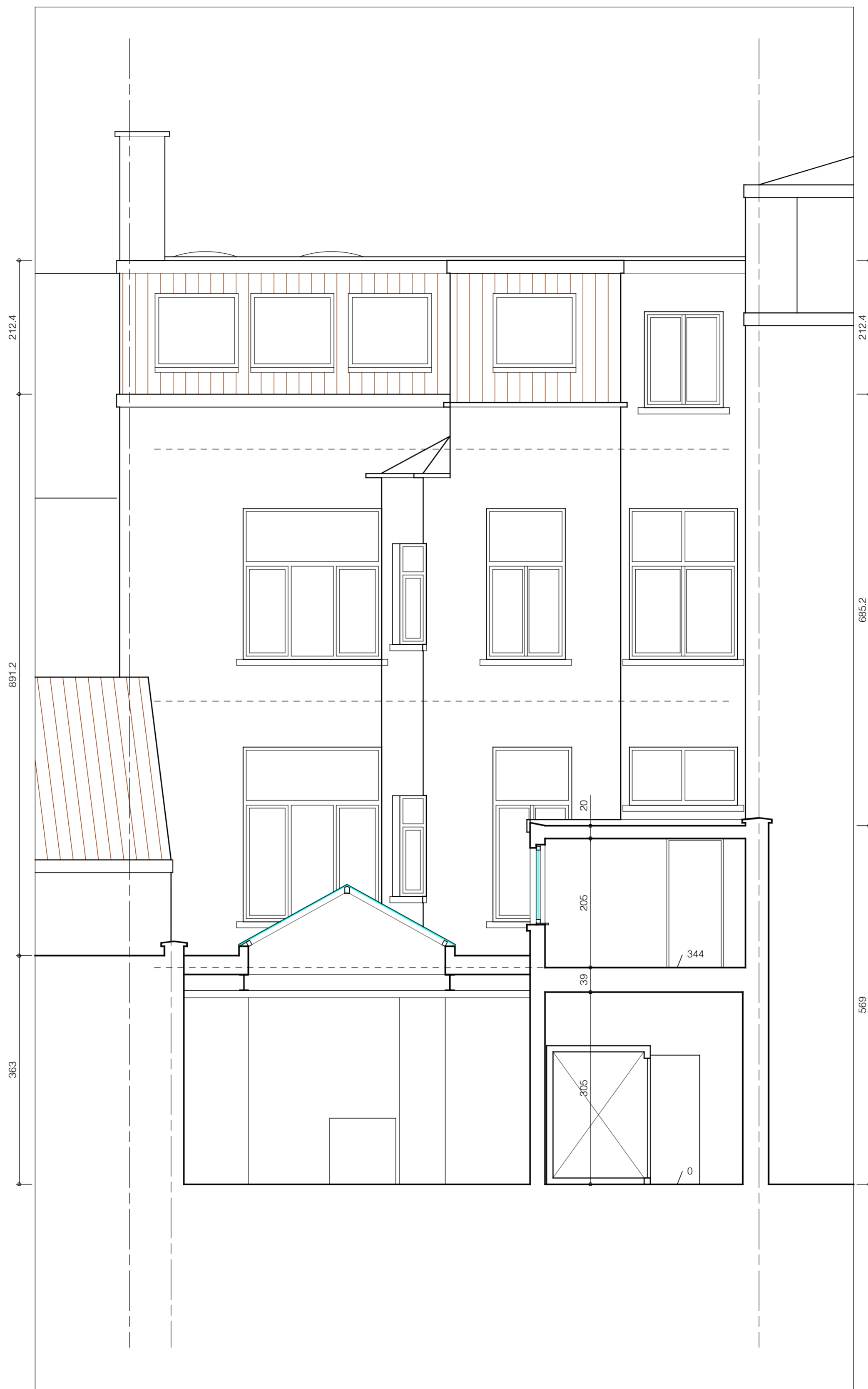
achtergevel - snede 2