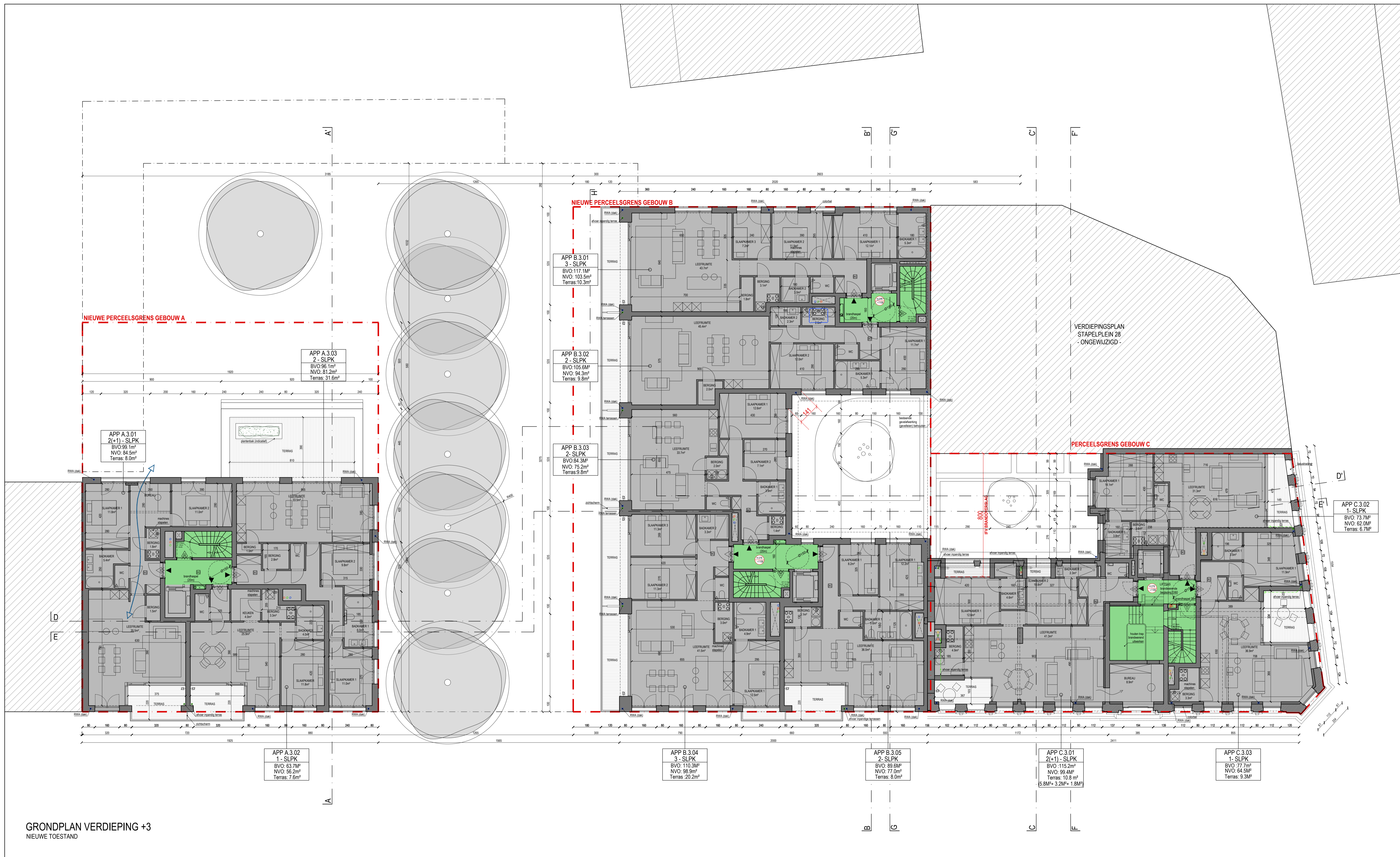
GRONDPLAN VERDIEPING +3 NIEUWE TOESTAND