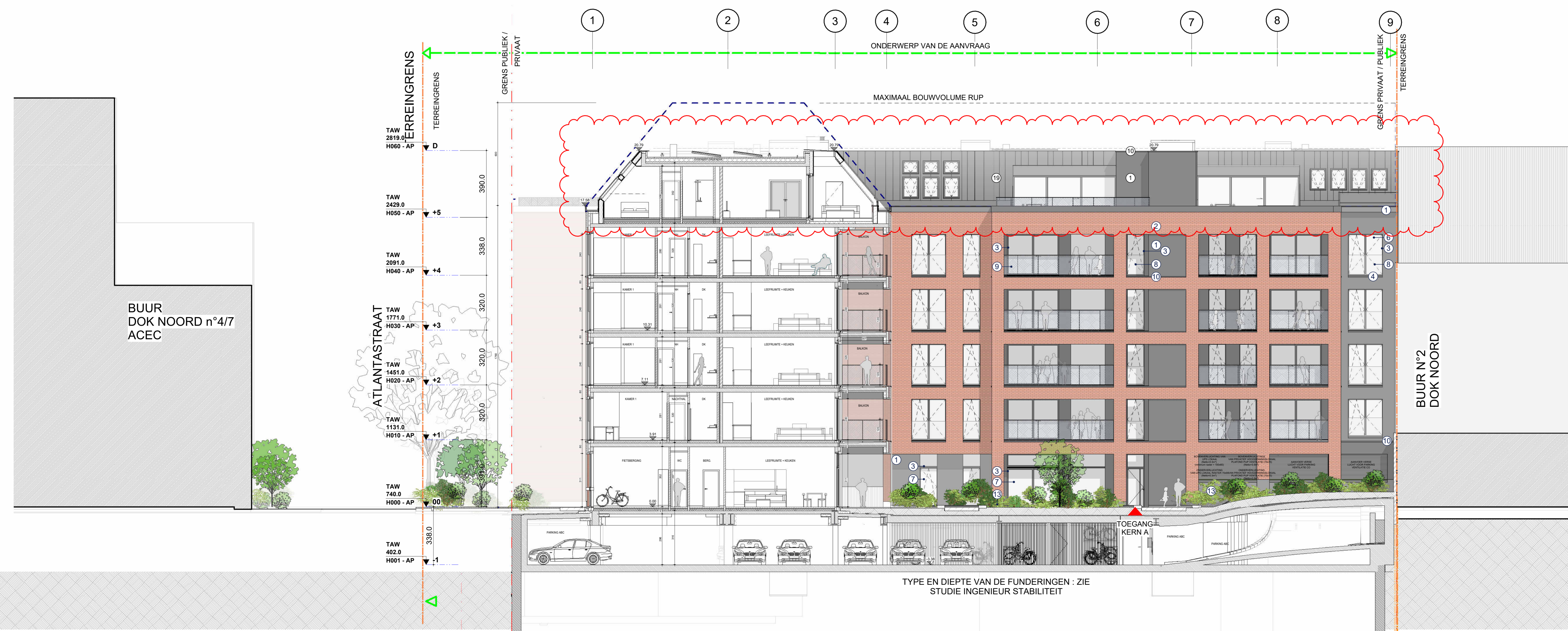
TYPE EN DIEPTE VAN DE FUNDERINGEN : ZIE STUDIE INGENIEUR STABILITEIT

Referentie BA_ABC_G_N_49_1902_GEVEL_7_WESTGEVEL GEBOUW A_B_PDF fase | auteur | gebouw/zone | referentie AR | ind. | plan n° OV | AR | AB | N20F07V09 | B | 49