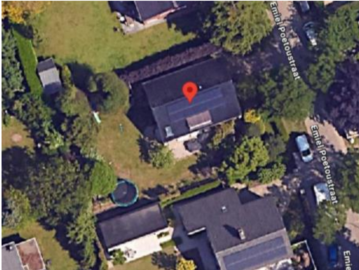
Figuur 2. We wensen boom 1 en 2 te vellen. Het betreffen 2 sierkerselaars met een omtrek van ongeveer 1m. ze staan op minder dan 2m van de perceelsgrens in het gazon. we wensen ze te vellen wegens de beperkte sierwaarde en ze hebben een matige tot slechte gezondheid.