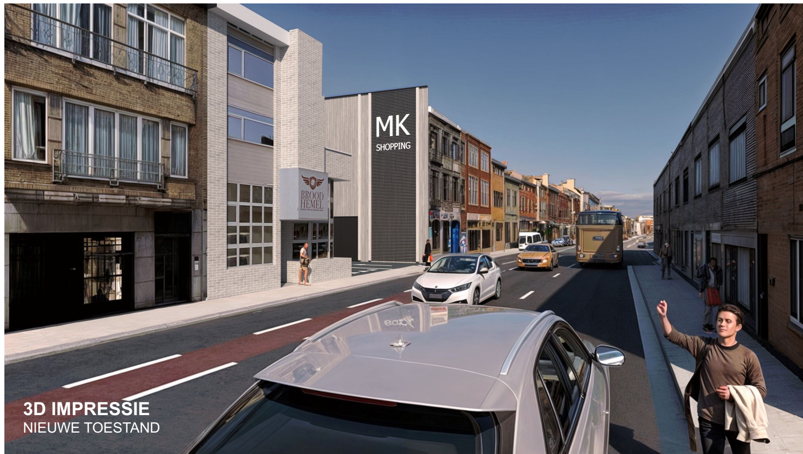
3D IMPRESSIE NIEUWE TOESTAND