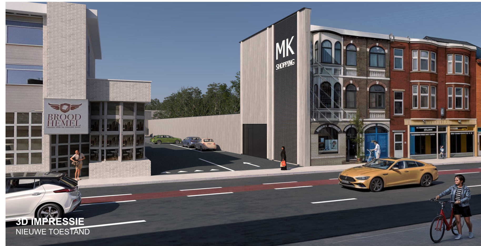
3D IMPRESSIE NIEUWE TOESTAND