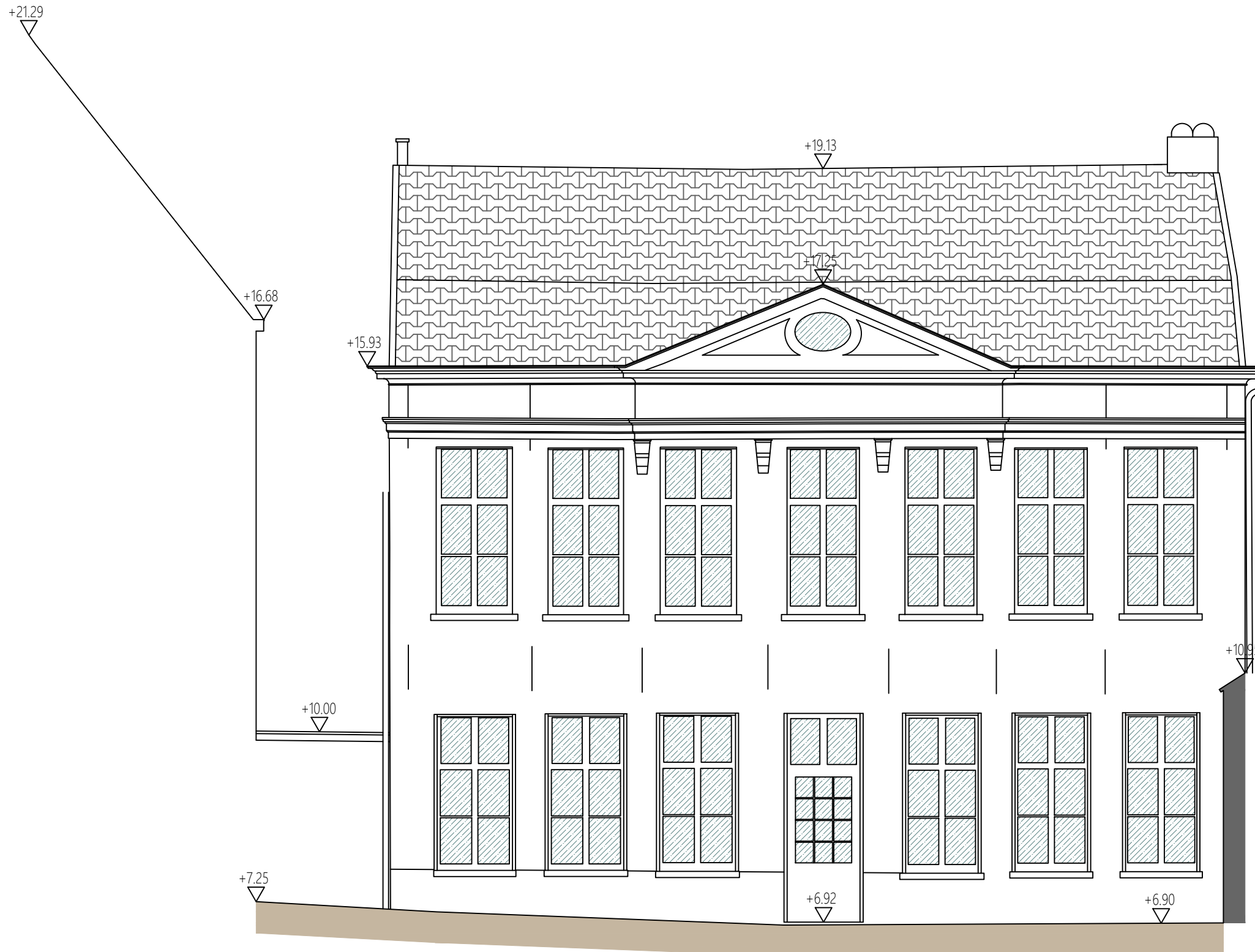
voorgevel nieuwe toestand