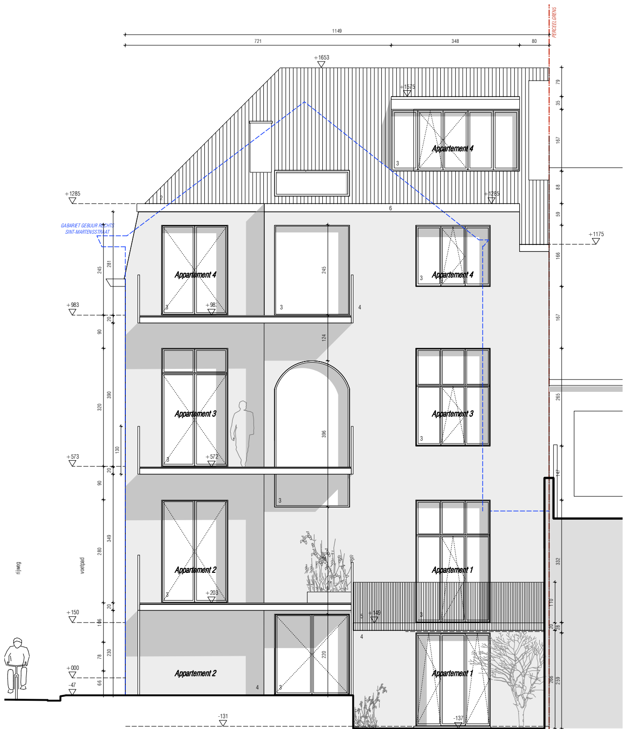
ACHTERGEVEL / SNEDE B