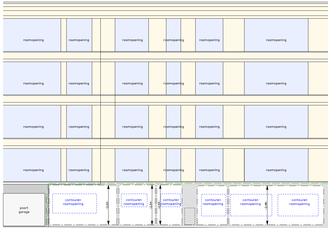
Snede aanzicht vanuit Lostraat