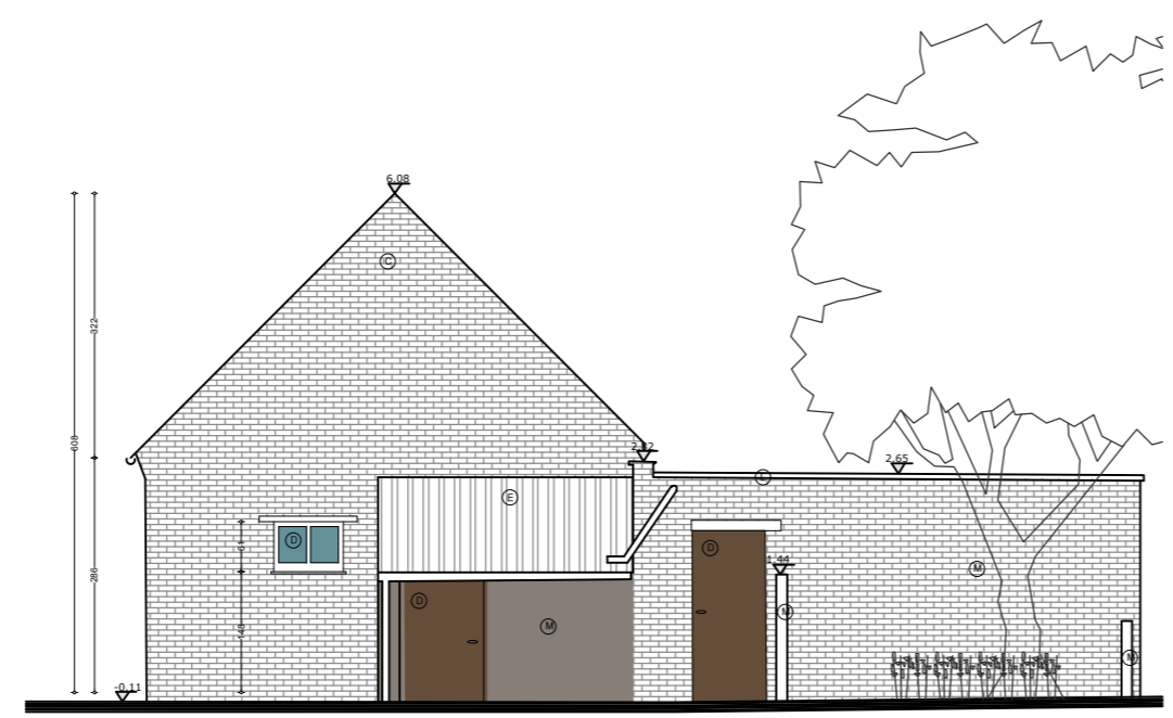
BESTAANDE ACHTERGEVEL BLIJFT ONGEWIJZIGD