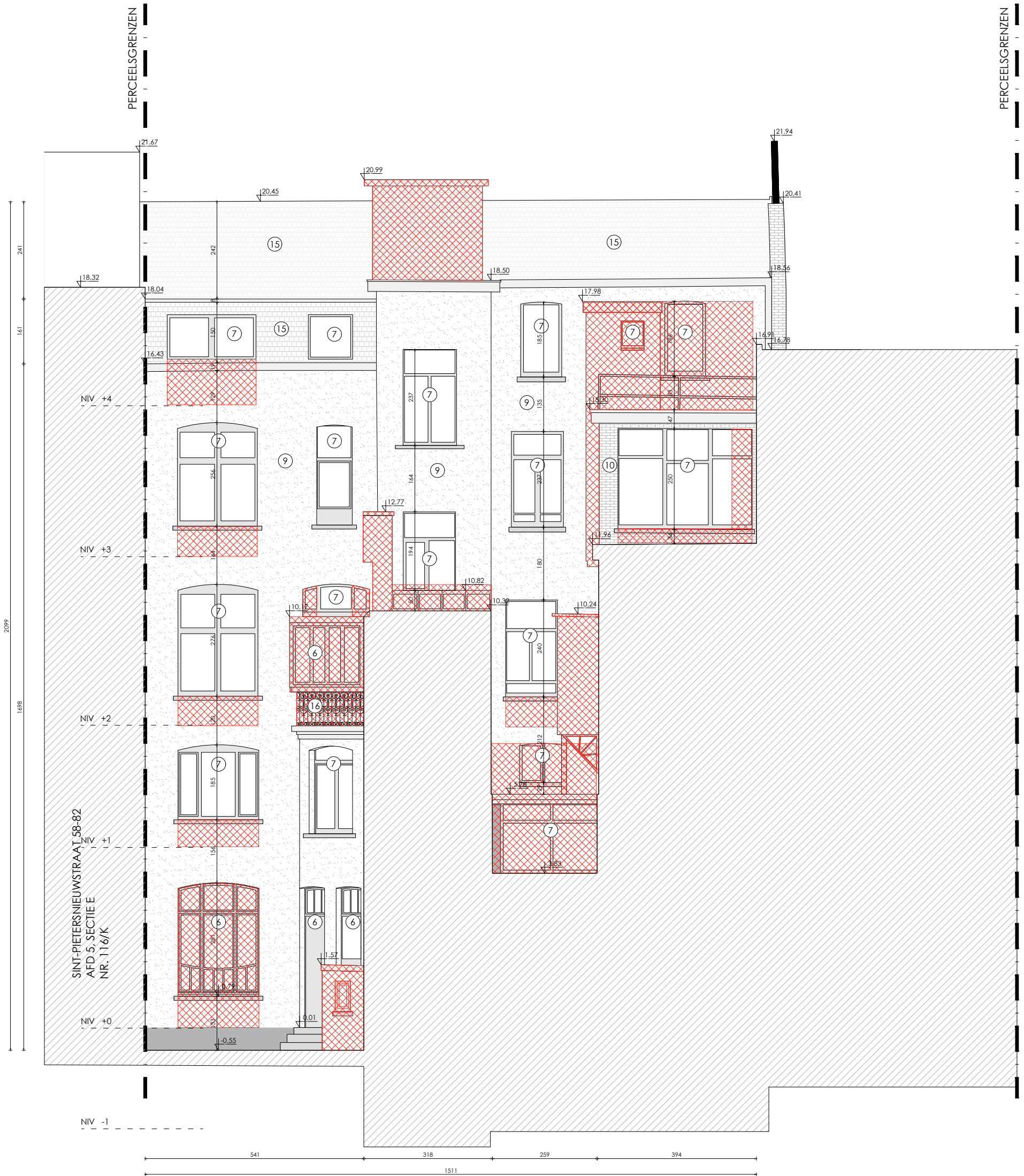
Sint-Pietersnieuwstraat 86 - 92 achtergevel