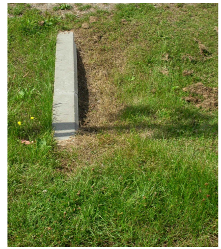
Referentiebeeld overloop in infiltratiegracht