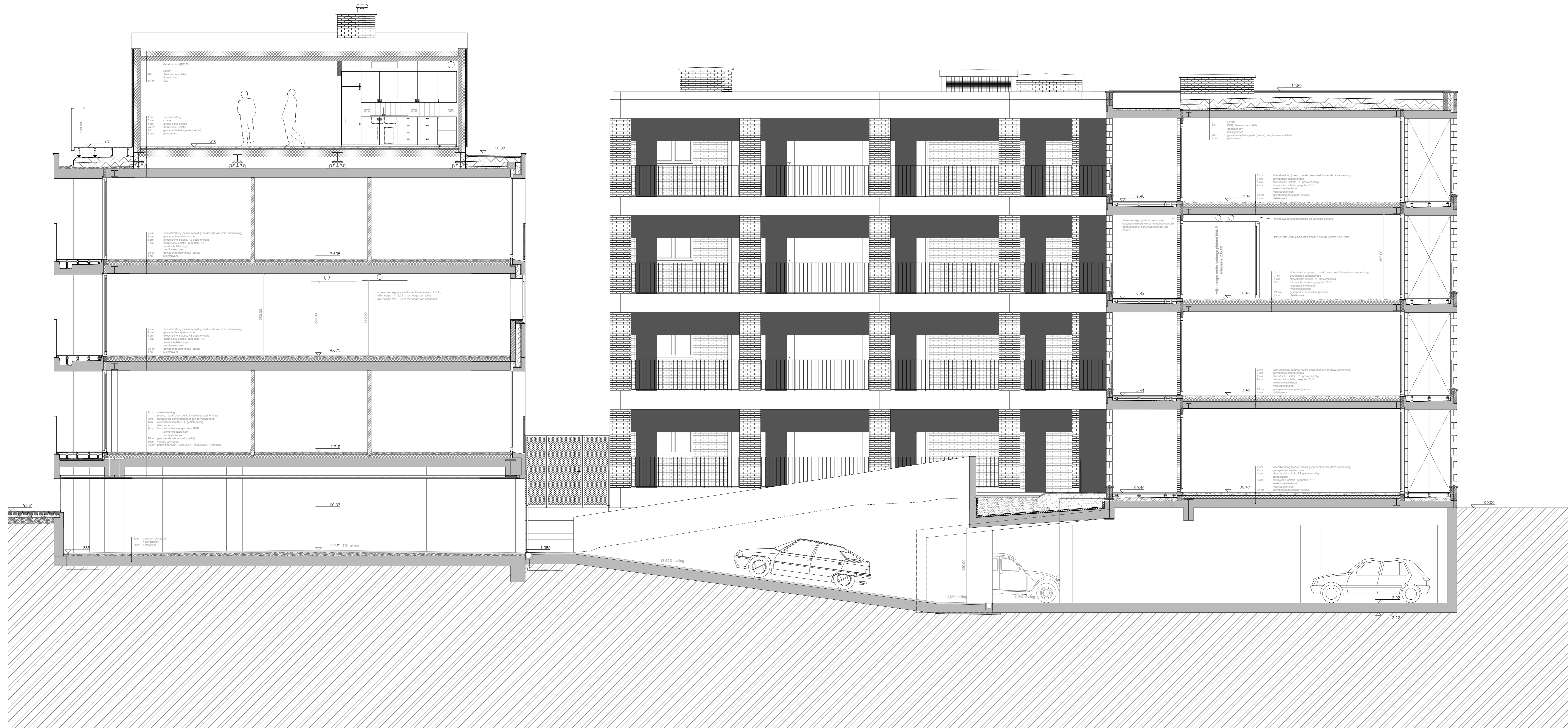
SNEDE DD _ BLOK A BLOK B