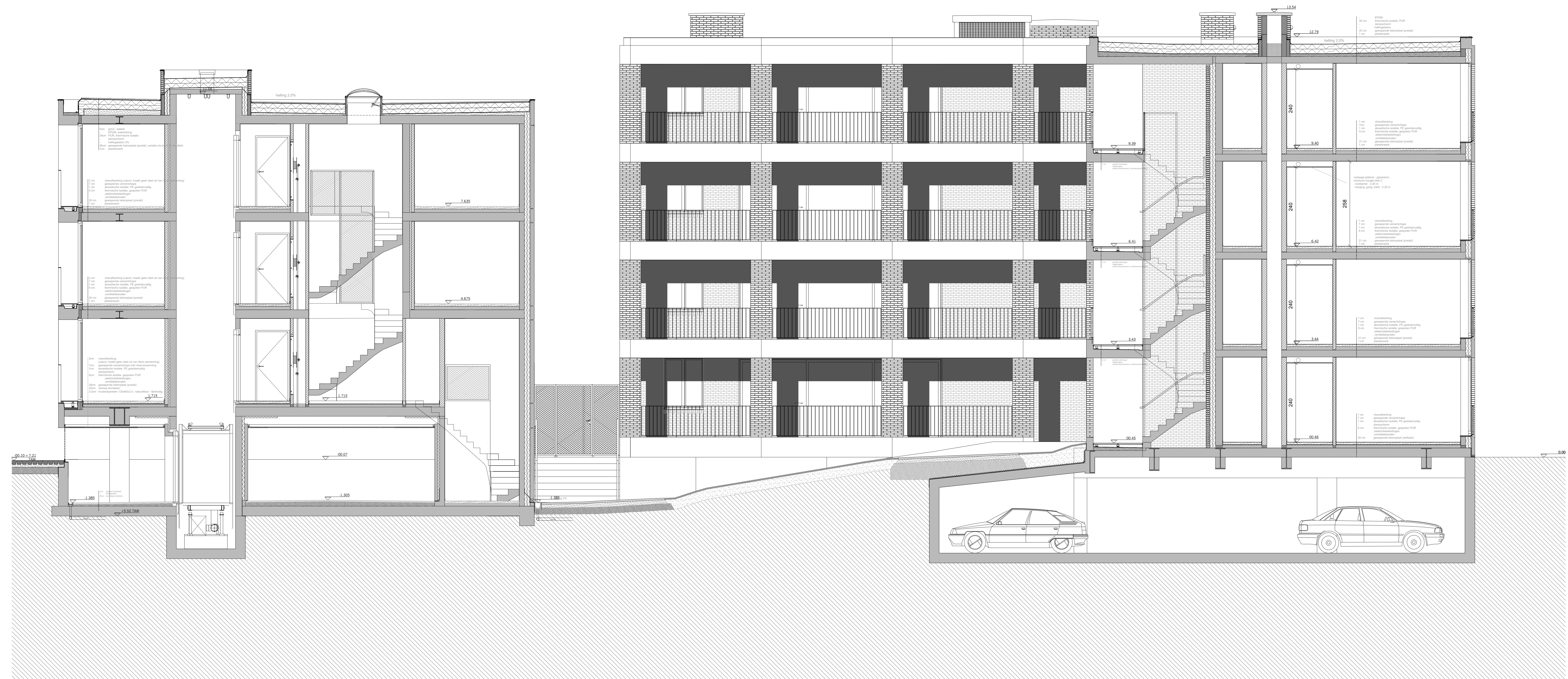
SNEDE BB _ BLOK A BLOK C